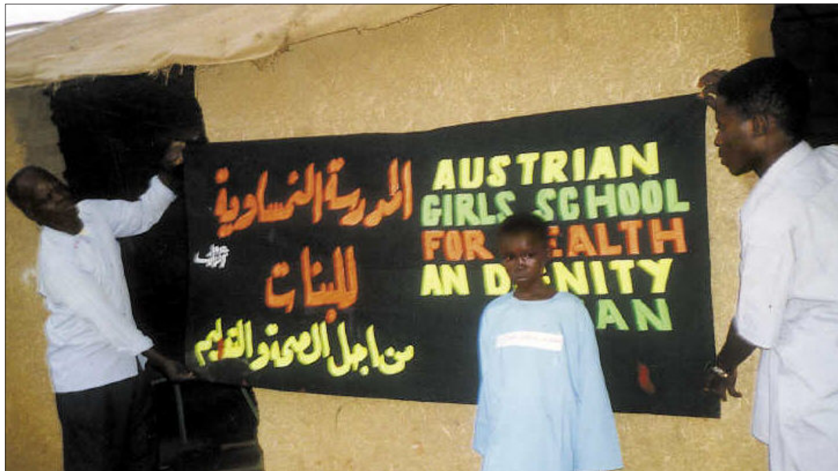
Noch steht die Mädchenschule in El Takumul nicht. Doch das Plakat, das von den erhofften neuen Chancen der Mädchen in dem sudanesischen Dorf kündigt, wird bereits stolz hoch gehalten.

Mädchen, deren Eltern auf die Beschneidung verzichten, sollen zur Schule gehen und einen Beruf erlernen dürfen. Damit seien sie gewappnet gegenüber gesellschaftlichen Sanktionen und in der Lage ein selbstbestimmtes Leben zu führen. So lautet die Überlegung Hagens. Und diese versucht sie nun umzusetzen. In El Takumul.